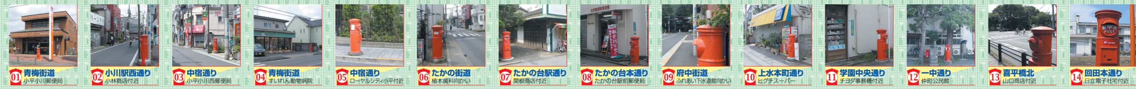
01 青梅街道 小平小川郵便局 02 小川駅西通り 小林商店付近 03 中信通り 小平小川西郵便局 04 青梅街道 さいれん動物病院 05 中信通り ローヤリティ小平付近 06 たかの街道 榎木薬科向かい 07 たかの台駅通り 関根商店付近 08 たかの台本通り たかの台駅前郵便局 09 府中街道 ふれあい下水道館向かい 10 上水本町通り ビッグスーパー 11 学園中央通り チヨダ事務機付近 12 一中通り 中町公民館 13 喜平橋北 山口商店付近 14 回田本通り 日立電子宅付近