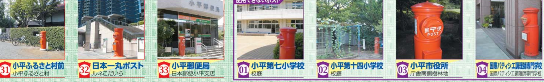
31 小平ふるさと村前 小平ふるさと村 32 日本丸ポスト ルネこだいら 33 小平郵便局 日本郵便小平支店 01 小平第七小学校 校庭 02 小平第十四小学校 校庭 03 小平市役所 庁舎南側樹林地 04 国分市庁舎工務局専門工務学校 国分市庁舎工務局専門工務学校