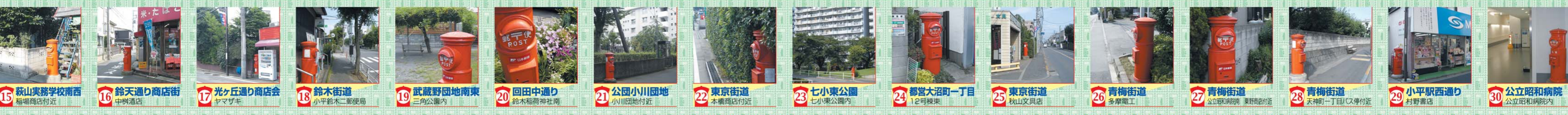
15 萩山実務学校南西 稲場商店付近 16 鈴天通り商店街 中興商店 17 光ヶ丘通り商店街 ヤマザキ 18 鈴木街道 小平鈴木二郵便局 19 武蔵野団地南東 三角公園内 20 回田中通り 鈴木稲荷神社前 21 公園小川団地 小川団地付近 22 東京街道 本橋商店付近 23 七小東公園 七小東公園内 24 都営大沼町一丁目 12時棟東 25 東京街道 秋山文具店 26 青梅街道 多摩電工 27 青梅街道 公立東陽病院 東野商店付近 28 青梅街道 天神一丁目バス停付近 29 小川駅西通り 村野書店 30 公立昭和病院 公立昭和病院内