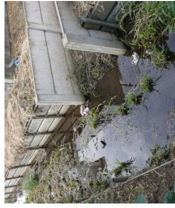
⑩ 野中用水南北分岐 (手前・南流 右・北流) 花小金井消防署東