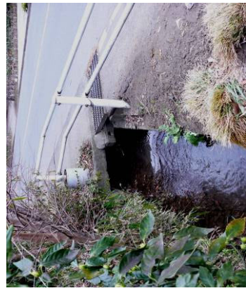
⑨ 鈴木用水南北分岐 (手前・南流 右・北流) (道路下) 鈴木町宝寿院東南・共済住宅バス停前