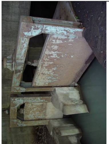
② 小川用水分岐水門 (左・小川用水 右・新堀用水) 小川橋上流側橋下。巻上機は1960年施工