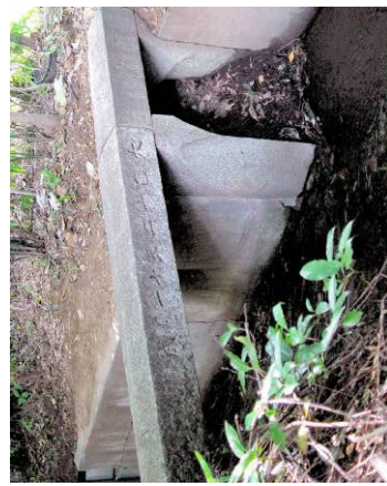
⑧ 田無用水分岐口 (左・田無用水 右・野野用水) 喜平橋東 「大正12年11月成」と彫られる。