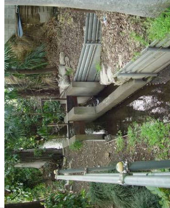
⑦ 天神町分岐水門 (手前・野中 右・大沼田用水) 天神町1丁目・天神町バス停南