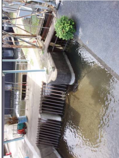
① 小平監視所内の新堀用水取水口 (左・上水本流赤止め 右側・新堀用水取水口)