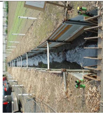
⑪ 大沼田用水流末 (手前・暗渠排水路) 東京街道七小入口交差点北