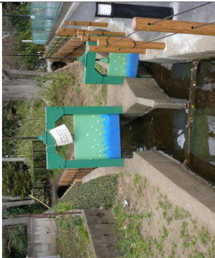
⑥ 回田町分岐水門 (左・大沼田 右・鈴木用水) 小平団地東交差点 巻上機は1973年施工