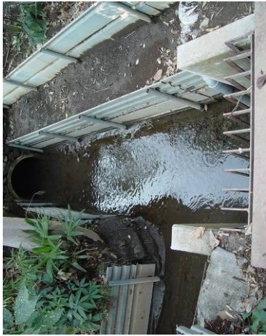
④ 小川用水南北水路合流地 (上・北側 左・南側) 天神町交差点北西