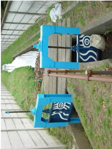
③ 小川用水南北分岐水門 (左・南側 右・北側流路) 小川一番バス停南。巻上機は1970年施工