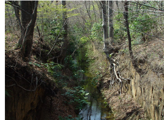
小平・くぬぎ橋から上流方向