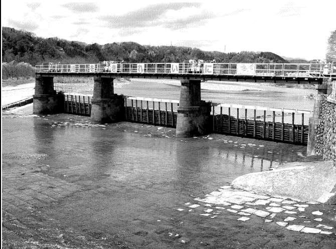
羽村取水堰（投渡堰）

残りは下流の小平監視所まで約12km玉川上水路を流れ、そこから地下の導水管で東村山浄水場に送られて水道水になる。