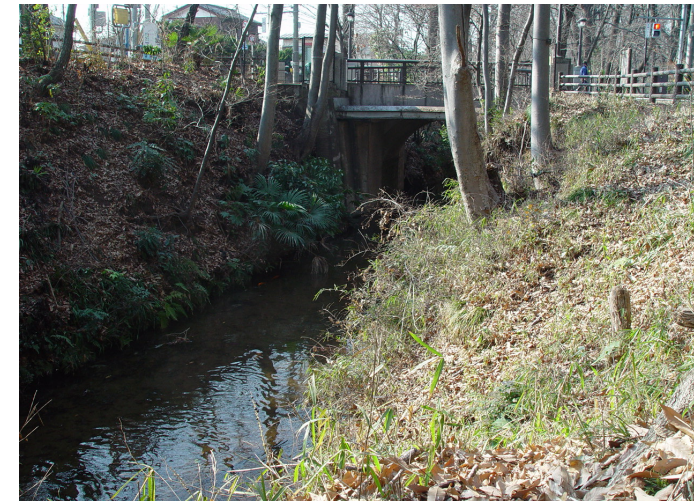
久右衛門橋と久保河岸(船溜り)跡